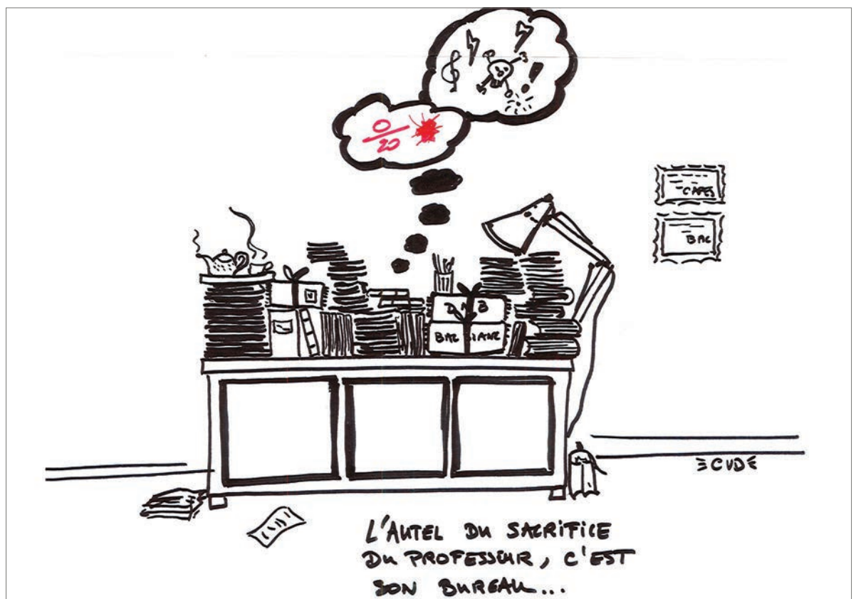
« Le sacrifice du prof de lettres », par Christophe VAISSIÈRE