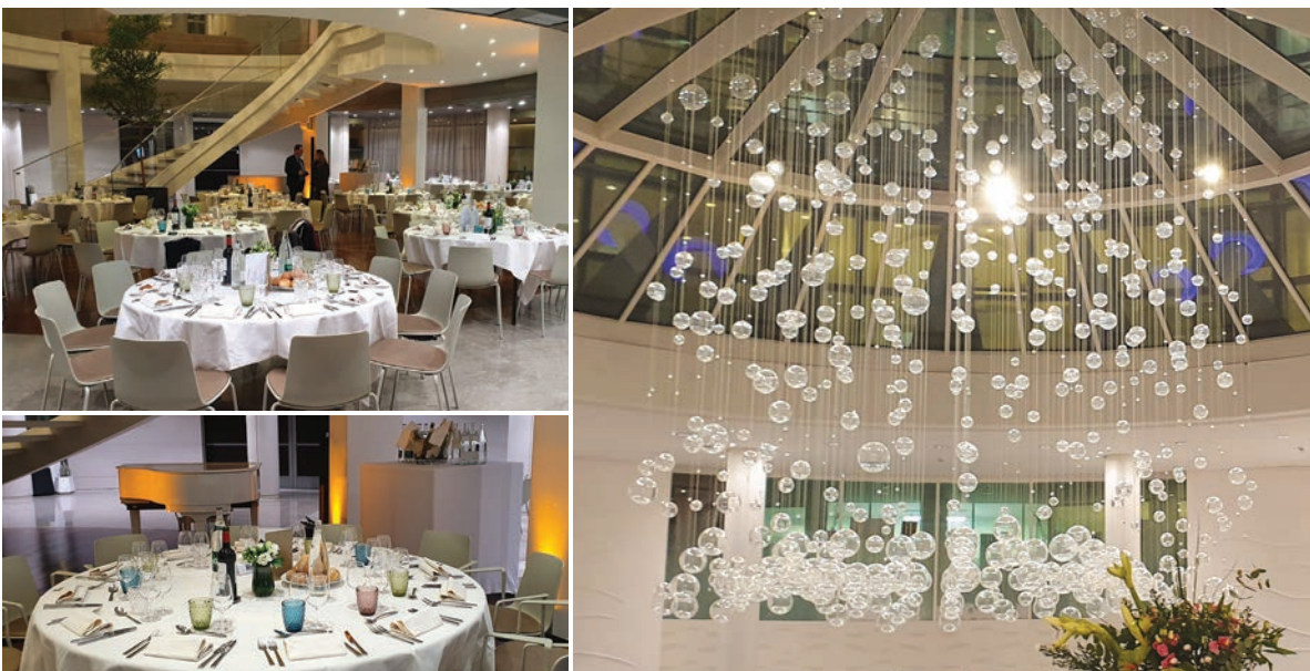
Soirée à Etoile Business Center

Je vous remercie à nouveau de votre présence et je vous souhaite une bonne soirée.